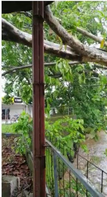
Imagen de video enviado por WhatsApp de la sede de Jicaral