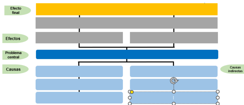
Figura 1 Árbol de problemas