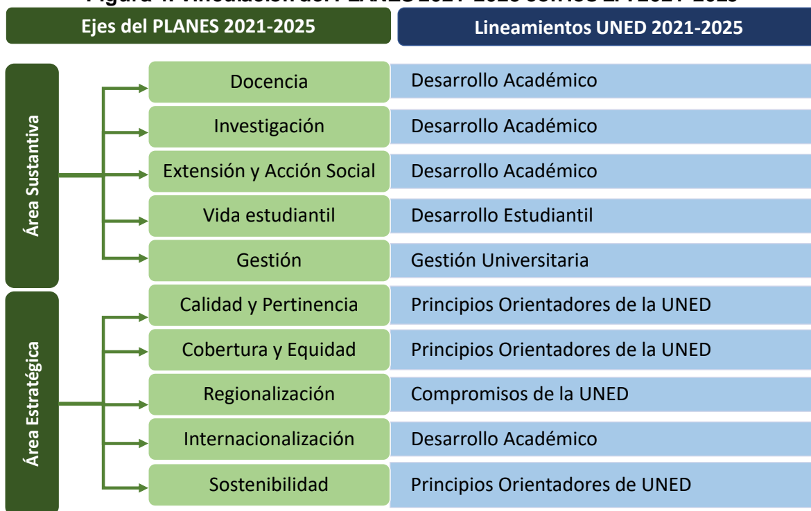
Figura 4. Vinculación del PLANES 2021-2025 con los LPI 2021-2025

Fuente: elaborado por el Centro de Planificación y Programación Institucional, octubre, 2020.