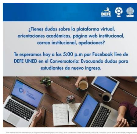
Figura 4. Ejemplo de anuncio para participar de un conversatorio dirigido a estudiantes.

Como programa líder en los procesos de virtualización institucional es indispensable que en ciertos momentos se comparta directamente con los estudiantes. De ahí que en el 2020, en conjunto con la Defensoría de los Estudiantes, se organizaran conferencias que abordaran algunas temáticas de interés para esta población.