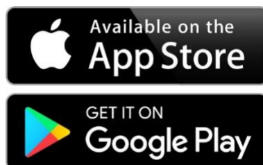
Figura 2. Logos correspondientes a las tiendas de aplicaciones en los que se publicó el App Campus Virtual UNED.

La misma está disponible para las dos tiendas de aplicaciones más empleadas actualmente (App Store y Play Store) Figura 2