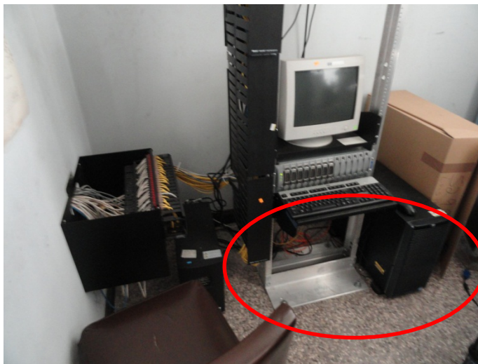
Fecha: 29/08/2013 EUNED