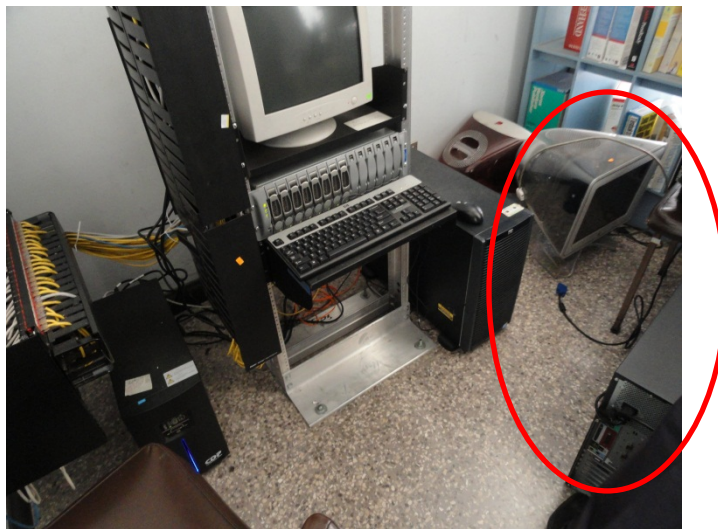
Fecha: 29/08/2013 EUNED